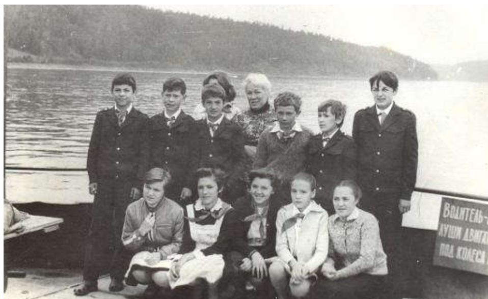
Отряд им. М.Г. Казанцева в походе по местам боевой славы. 1982 г.